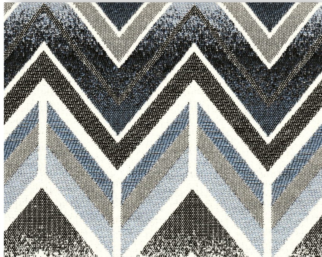
Heartbeat - 805.413