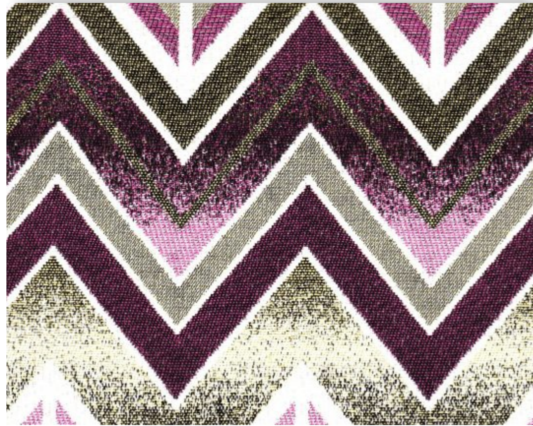
Heartbeat - 805.395